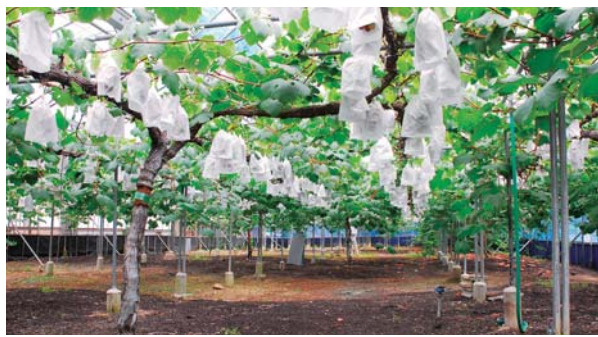
一房ずつ丁寧に袋を掛けています