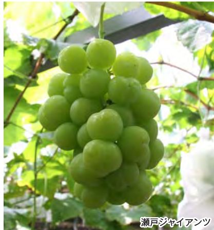
瀬戸ジャイアンツ