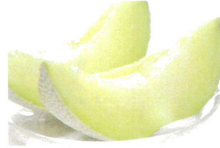
静岡県産 クラウン温室メロン