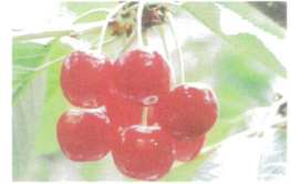
山形県産 東根さくらんぼ(佐藤錦)