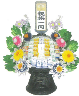
盛籠【フリーズドライ】