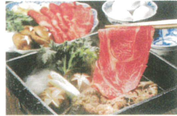
三重県産 松阪牛モモすき焼き用